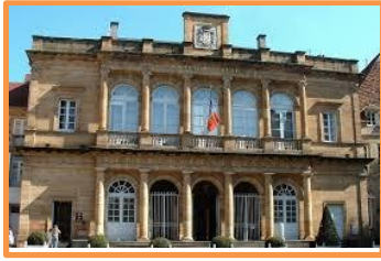
Hôtel de ville