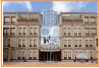
l'Hôtel du département